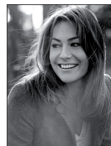
Shirley Bousquet Comédienne