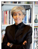
Claudie Haigneré astronaute