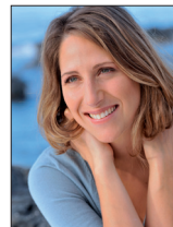
Maud Fontenoy Navigatrice