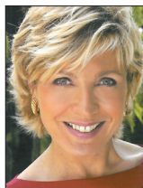
Evelyne Dhéliat Présentatrice Météo